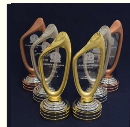
2017 14回 G-1グランプリ開始