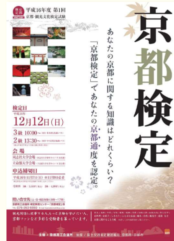
2004 1回 第1回検定実施